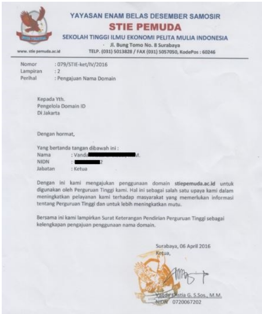
Contoh akta pendirian universitas