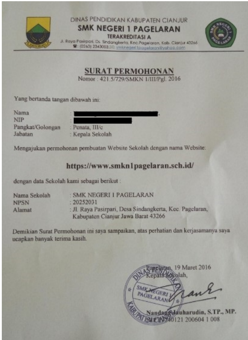
Download Contoh Surat Permohonan sch.id